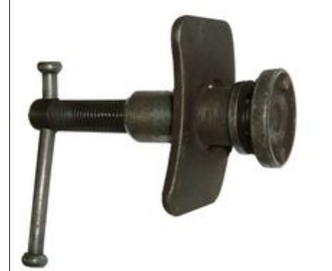
Abb.6 Spezialwerkzeug Bremskolbenrücksteller